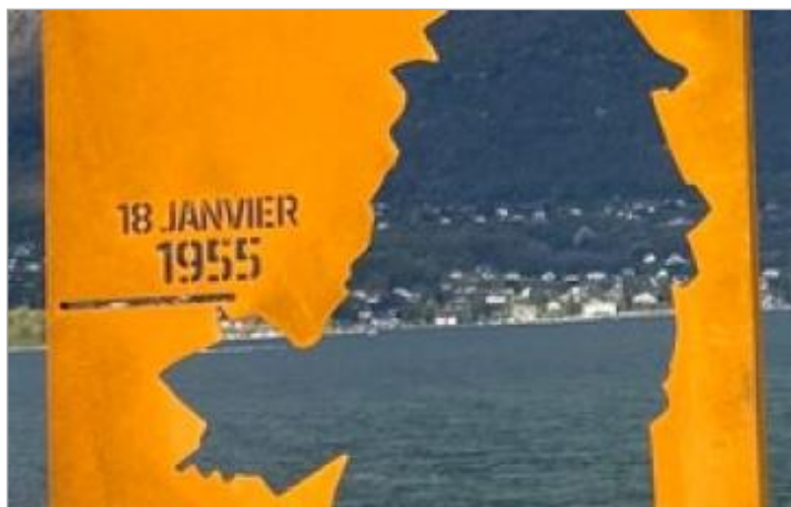
Repère de crue 18 janvier 1955