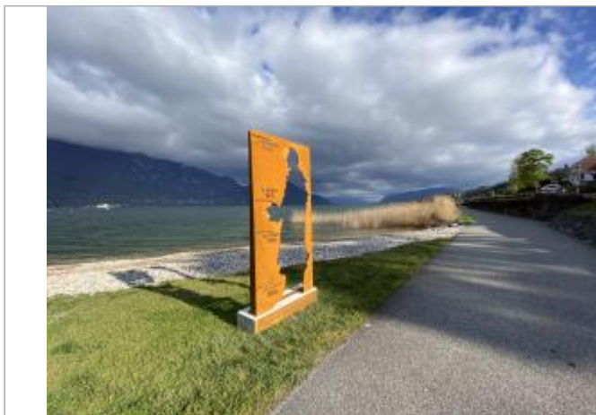
Silhouette Alphonse de Lamartine