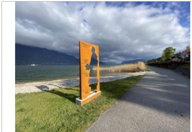
Silhouette Alphonse de Lamartine