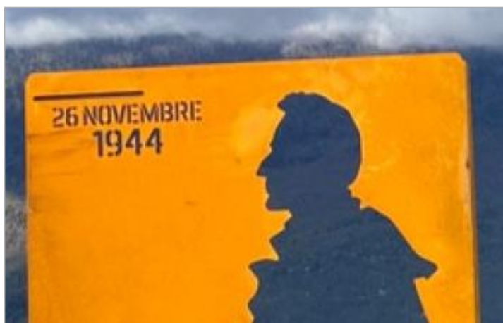
Repère de crue 26 novembre 1944