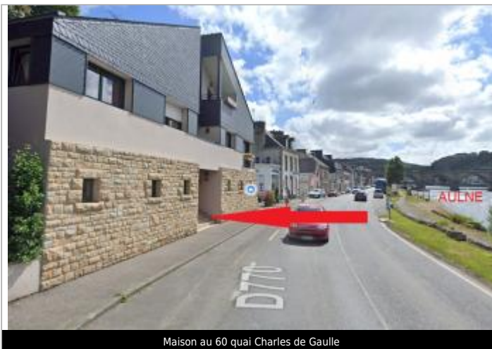
Maison au 60 quai Charles de Gaulle

Coordonnées WGS84 : X: -4.08653587 / Y: 48.19851600