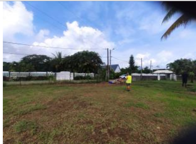
Vue depuis le terrain privé