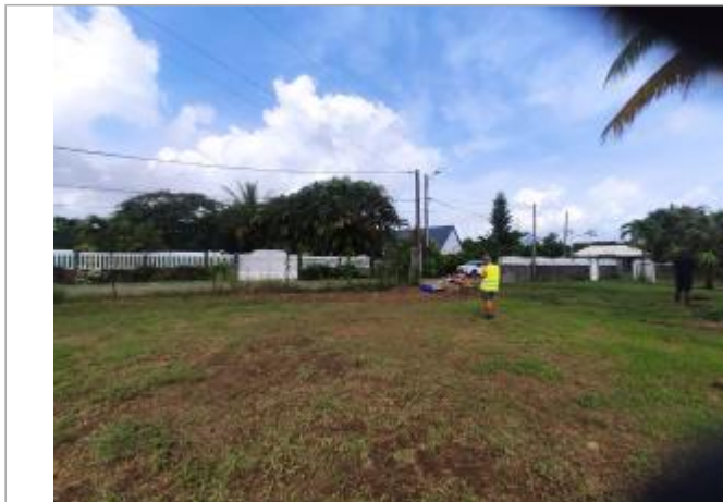
Vue depuis le terrain privé