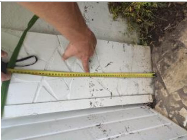
Dépôt de matières solides

Altitude calculée de l'eau (en m) : 2.271