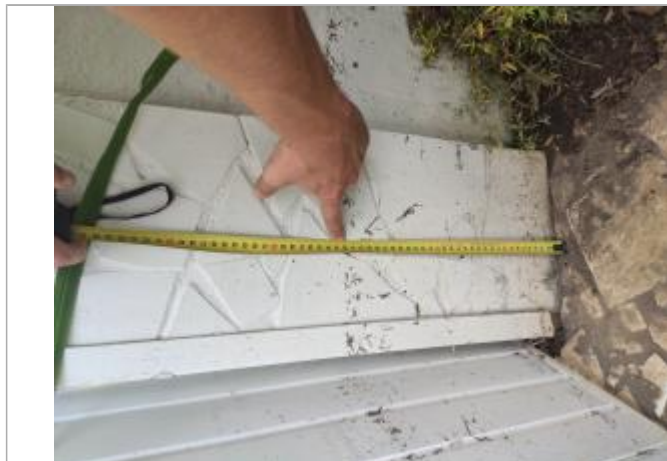
Dépôt de matières solides

Altitude calculée de l'eau (en m) : 2.271