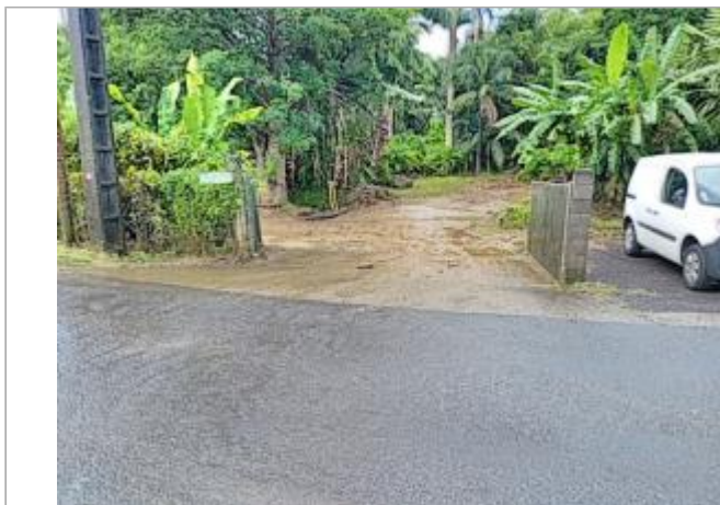
Vue depuis la route