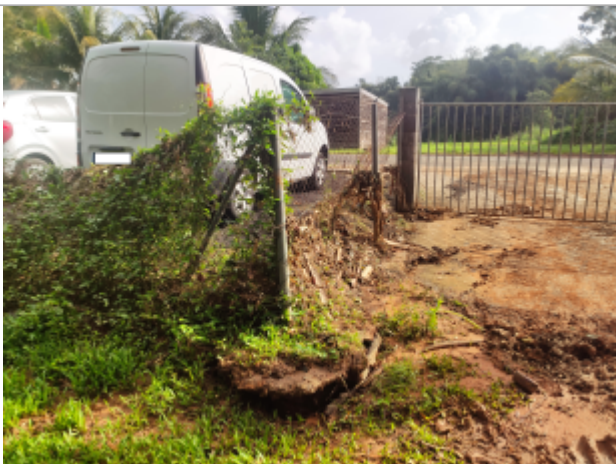
Dépôts de matières solides

Altitude calculée de l'eau (en m) : 23.458 m