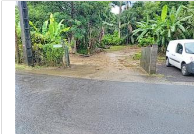
Vue depuis la route

Coordonnées WGS84 : X: -61.62968320 / Y: 16.20718930