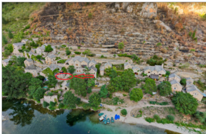
vu du site depuis la rive droite du Tarn- google image août 2022