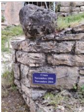
Vue du repère, auteur: M Daubas, 2023