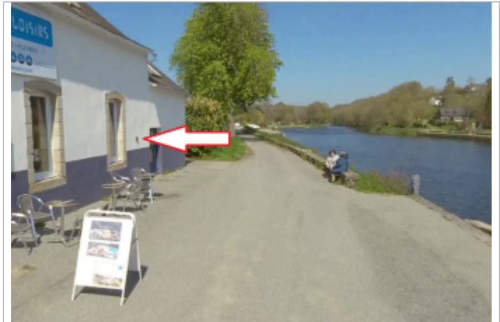
Vue du site, avril 2023

Coordonnées WGS84 : X: -3.98447770 / Y: 48.19137550