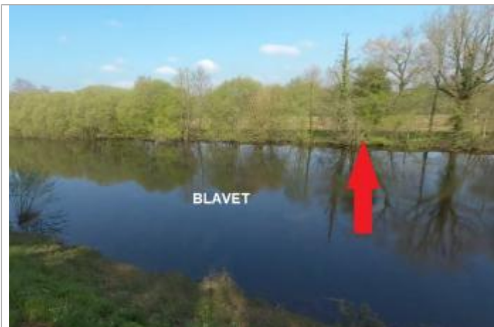
Berge du Blavet rive droite