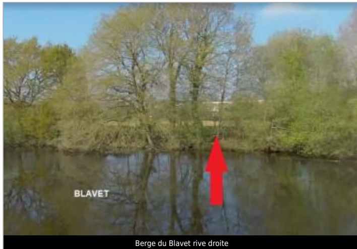
Berge du Blavet rive droite