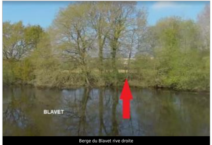
Berge du Blavet rive droite

Coordonnées WGS84 : X: -2.96998393 / Y: 48.03553060