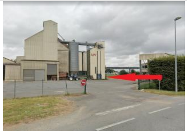
Entreprise agro-alimentaire, ancien puit (disparu)

Coordonnées WGS84 : X: -2.96005249 / Y: 48.04732310