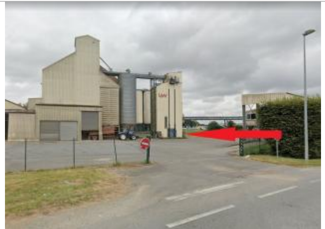
Entreprise agro-alimentaire, ancien puit (disparu)