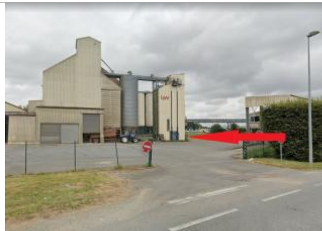
Entreprise agro-alimentaire, ancien puit (disparu)

Coordonnées WGS84 : X: -2.96005249 / Y: 48.04732310