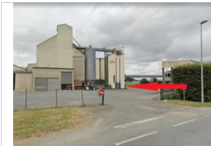
Entreprise agro-alimentaire, ancien puit (disparu)

Altitude calculée de l'eau (en m) : 53.62