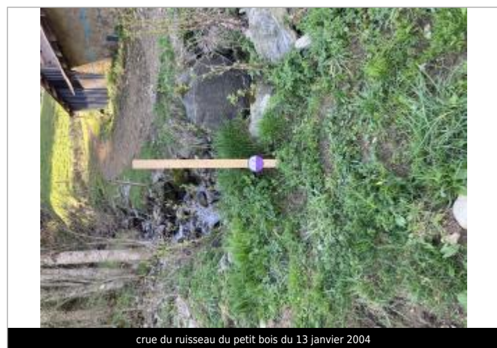
crue du ruisseau du petit bois du 13 janvier 2004