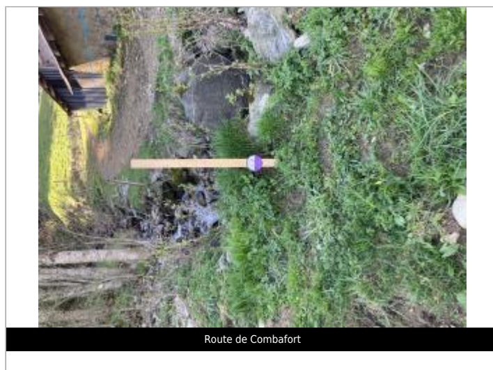
Route de Combafort