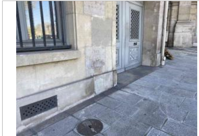
Repère de crue "Crue janvier 1910". 19, impasse de Conti. Paris, 6e.