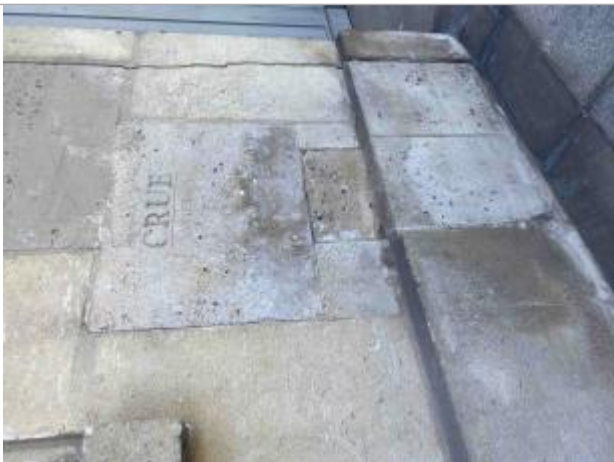
Repère de crue "Crue janvier 1910". 19, impasse de Conti. Paris, 6e.