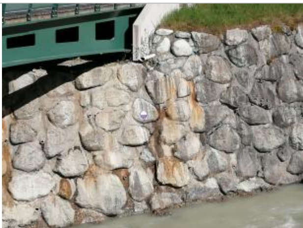
crue de l'Arve du 24-25 juillet 1996