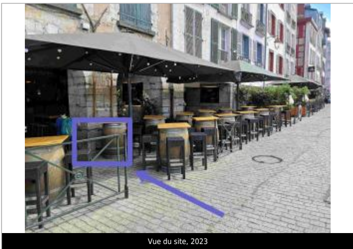
Vue du site, 2023

GÉOLOCALISATION Coordonnées WGS84 : X: -1.47414876 / Y: 43.48998810 Coordonnées RGF93 (Lambert 93) X: 338127.82 / Y: 6275910.48 Coordonnées RGF93 (ETRS89) : X: -1.4741488 / Y: 43.4899881 Code Hydro: Q9--0250 Rive de référence: Droite