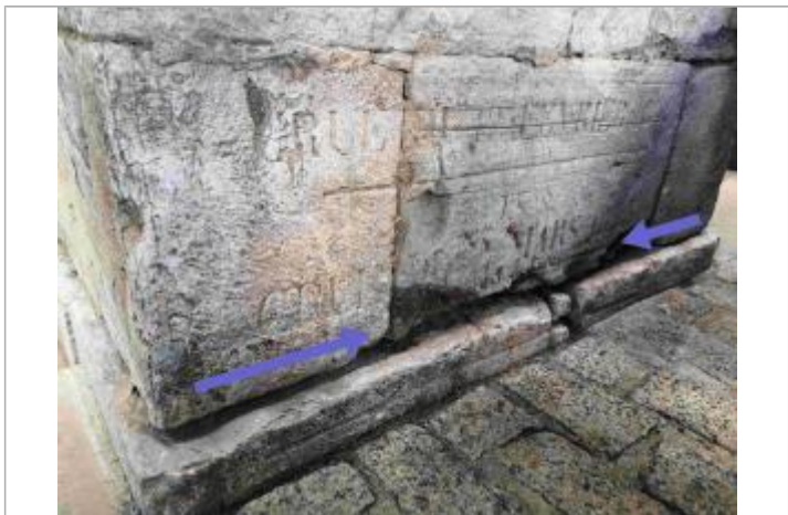
Vue du repère, 2023

MARQUE Texte : CRUE DU ?? MARS 18(75?) Maximum de l'inondation : Oui Visibilité : Oui État du repère : Mauvais Pérennité : Moyenne