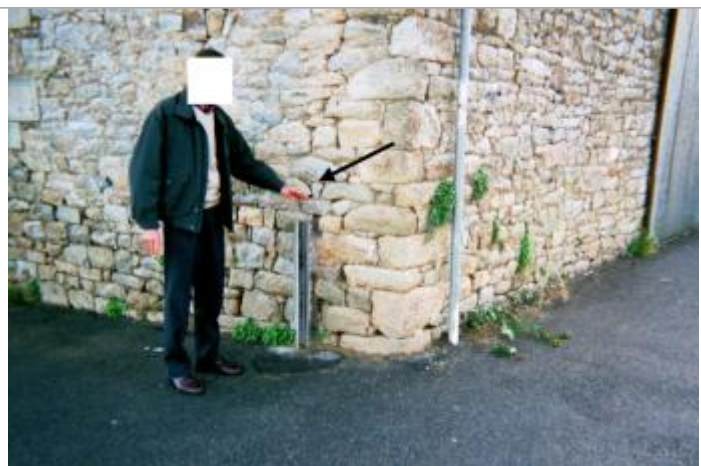
Batardeau de protection à l'angle de la rue du halage

Description référence du repère : sol au pied du batardeau de protection