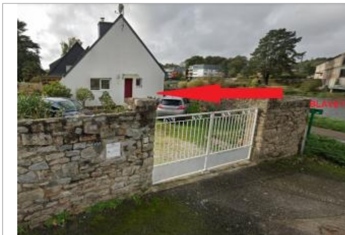
maison au 2 rue du halage à Hennebont