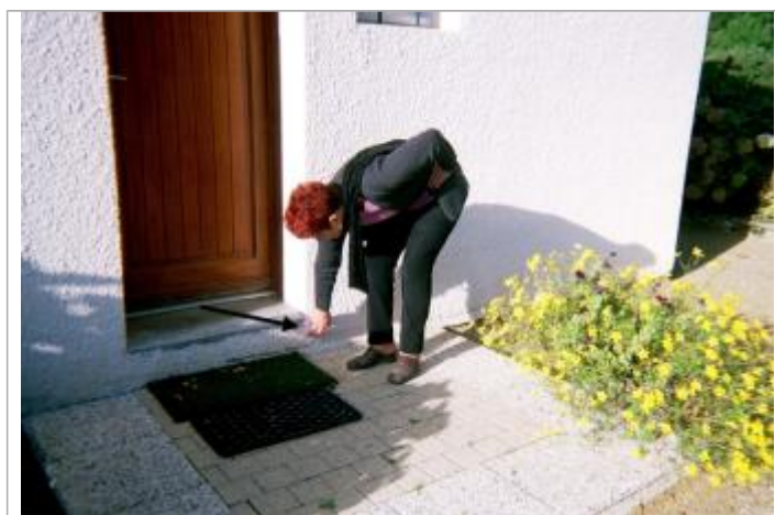
porte d'entrée de la maison

Différence entre le niveau d'eau et la référence (en m) : 0.050 m