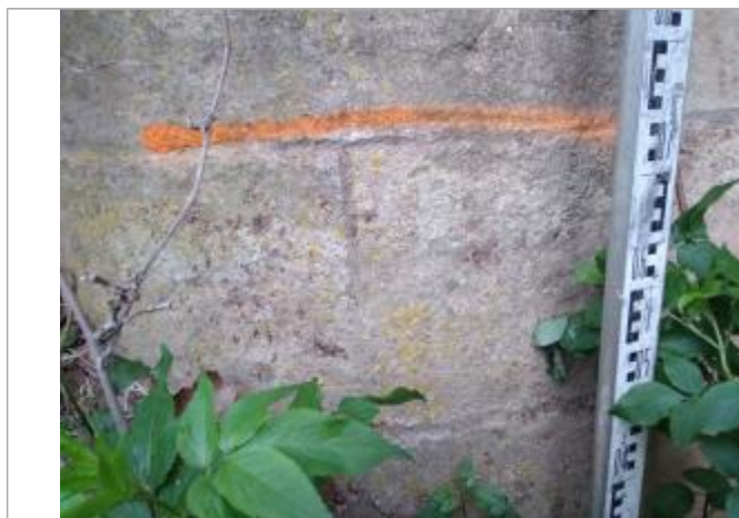
Trace sur le pile du pont