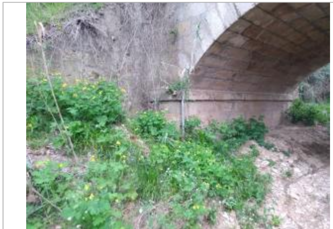
Pile de pont

Coordonnées WGS84 : X: 3.03966650 / Y: 43.36231490