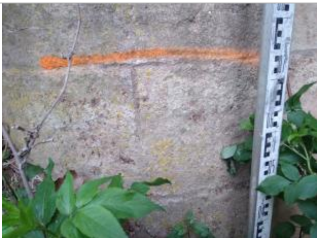
Trace sur le pile du pont

Altitude calculée de l'eau (en m) : 64.43 m