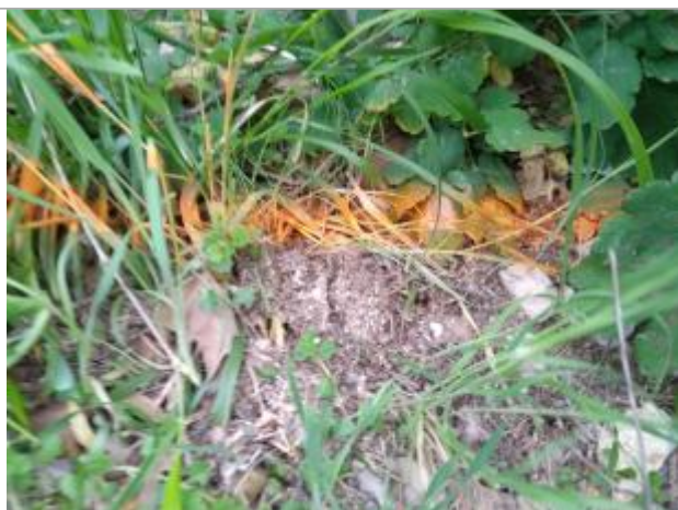
Dépôt en berge