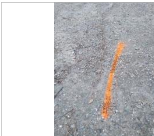
Dépôt sur le chaussée