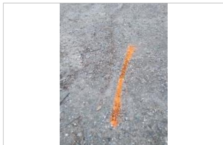
Dépôt sur la chaussée

GÉNÉRAL Code : 23_ORB22_R_813_1 Date de mise à jour : 26/04/2023 Auteur : SPC MO