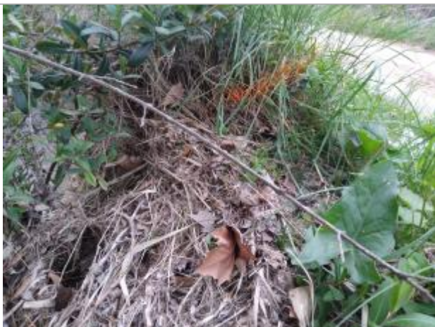
Dépôt en haut de talus

Altitude calculée de l'eau (en m) : 60.509 m