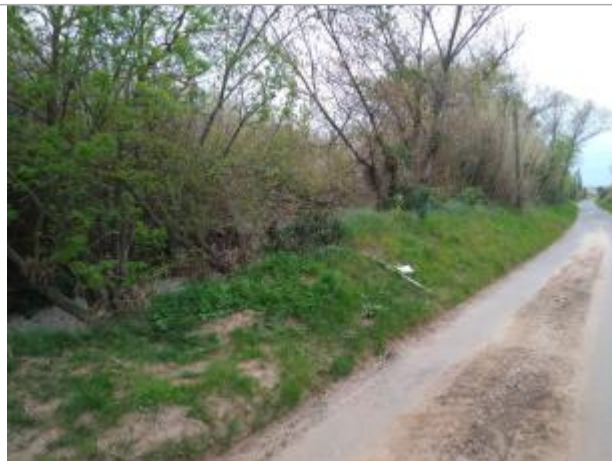
Talus au bord du chemin