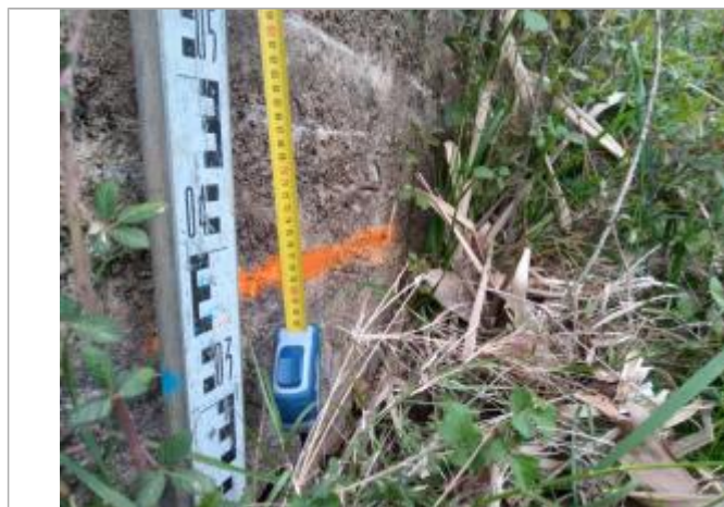
Dépôt contre le mur