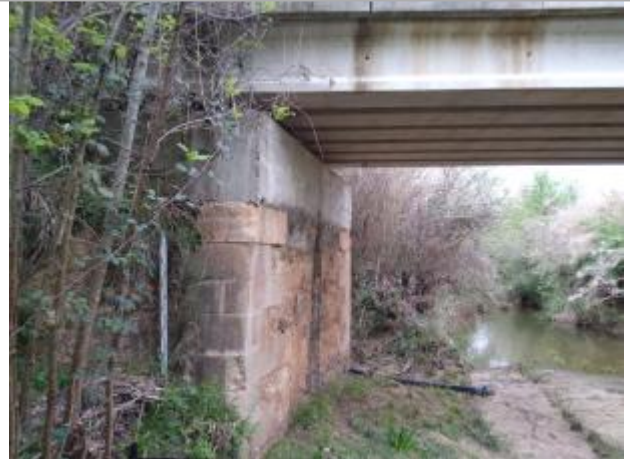
Culée du pont

Coordonnées WGS84 : X: 3.07755050 / Y: 43.35437790