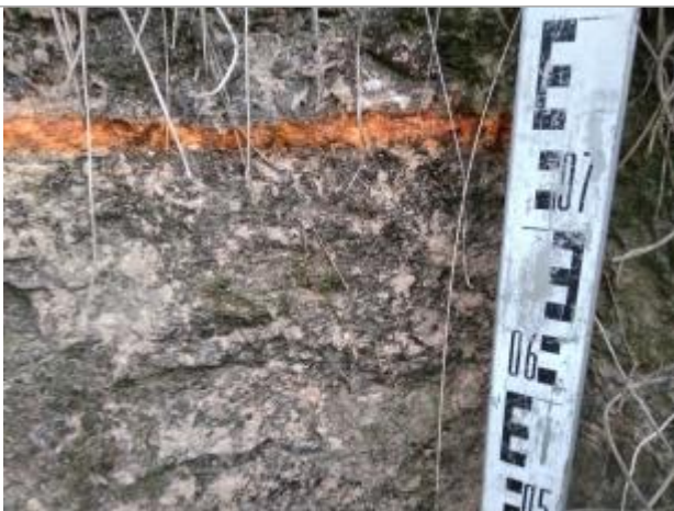
Trace sur le culée du pont