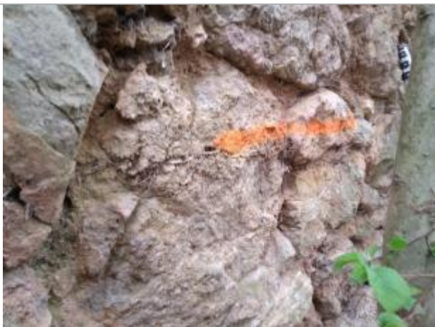
Trace sur le mur