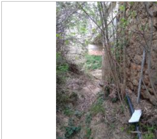
Mur de soutènement de la route

Coordonnées WGS84 : X: 3.07749010 / Y: 43.35435990