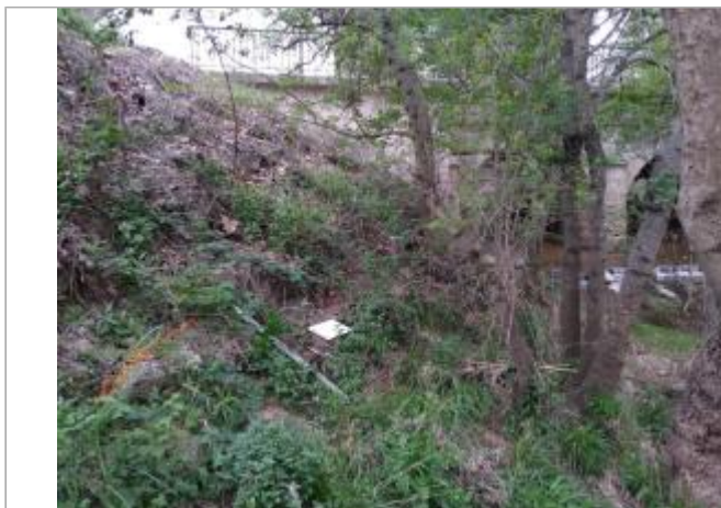
Berge à l'aval du pont