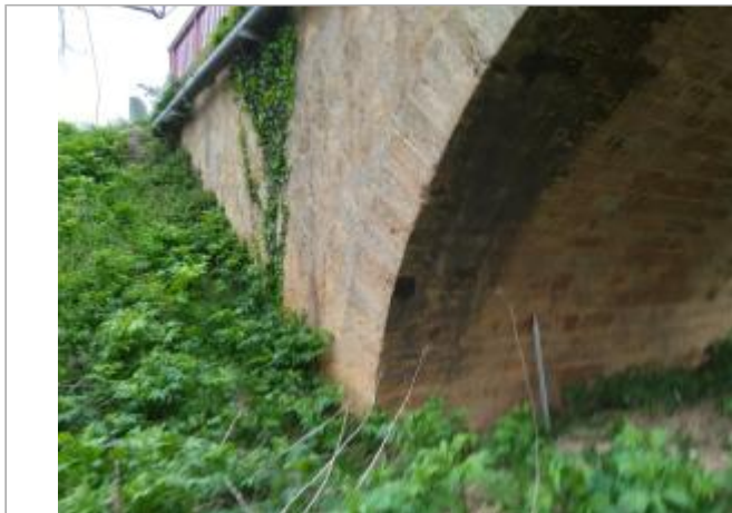
Arche du pont