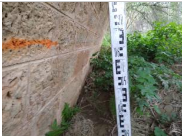
Trace sous l'arche de pont

Altitude calculée de l'eau (en m) : 33.86 m