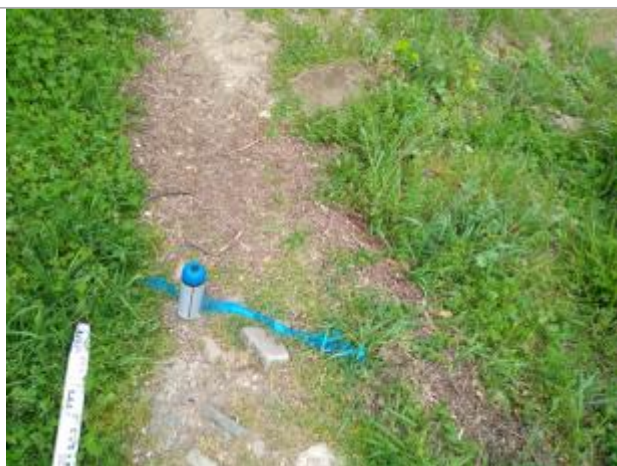
Dépôt sur le sentier