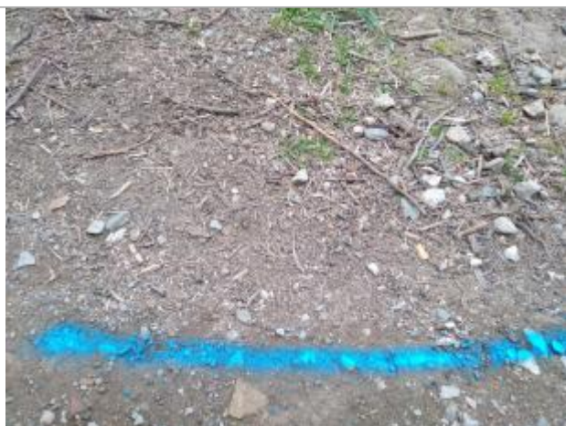
Dépôt sur le sentier

Altitude calculée de l'eau (en m) : 115.66 m