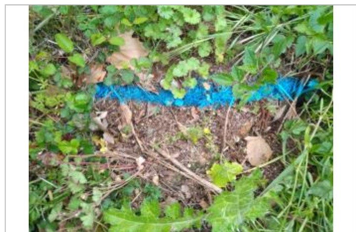
Dépôt en haut de berge

GÉNÉRAL Code : 23_ORB22_R_791_1 Date de mise à jour : 26/04/2023 Auteur : SPC MO