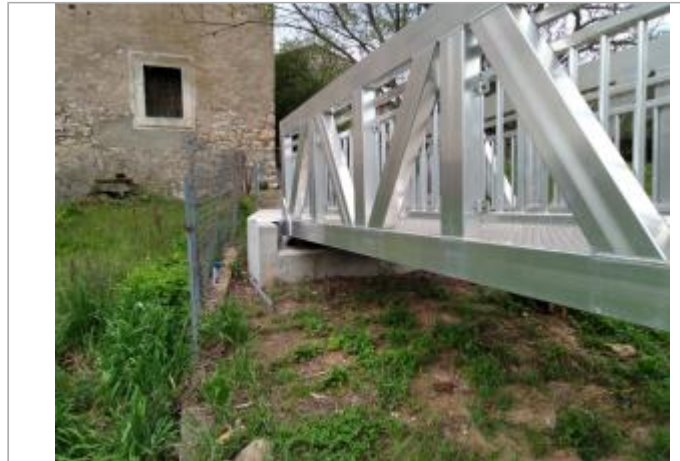
Massif béton de la passerelle