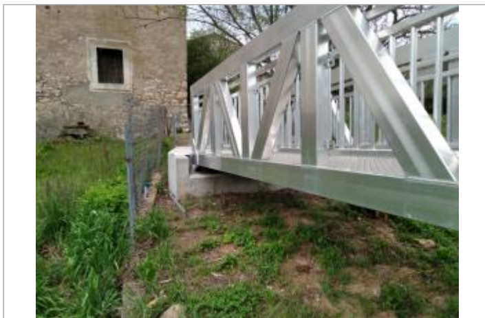
Massif béton de la passerelle