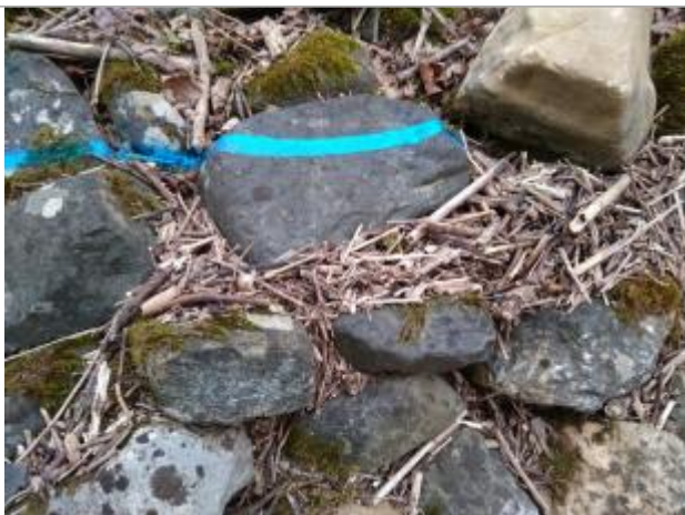
Dépôt sur les gabions

Altitude calculée de l'eau (en m) : 89.047 m