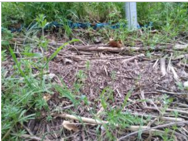
Dépôt sur la berge

Altitude calculée de l'eau (en m) : 73.49 m