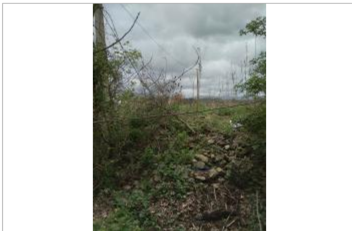
Haut de berge