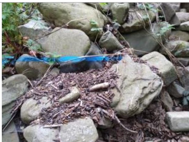
Dépôt en haut de berge