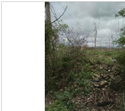
Haut de berge

Coordonnées WGS84 : X: 3.00281660 / Y: 43.44638430