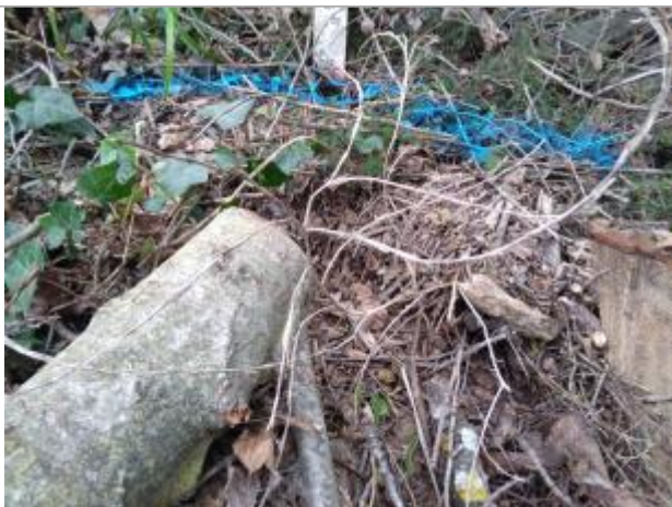
Dépôt en haut de berge

Altitude calculée de l'eau (en m) : 72.24 m