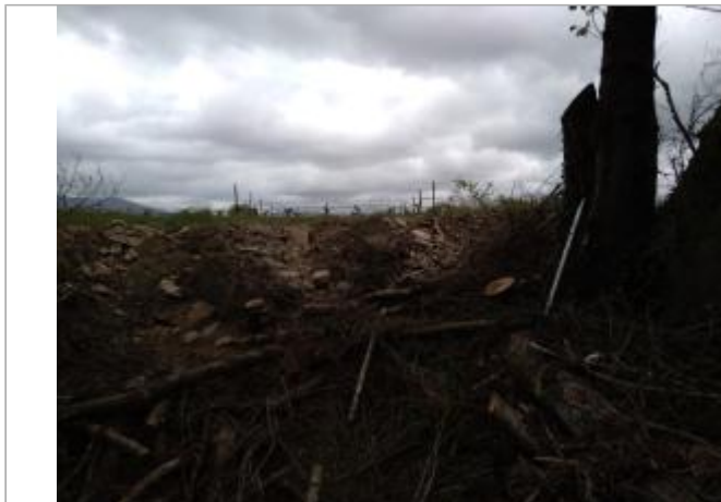
Haut de berge

Coordonnées WGS84 : X: 3.00347470 / Y: 43.44669920