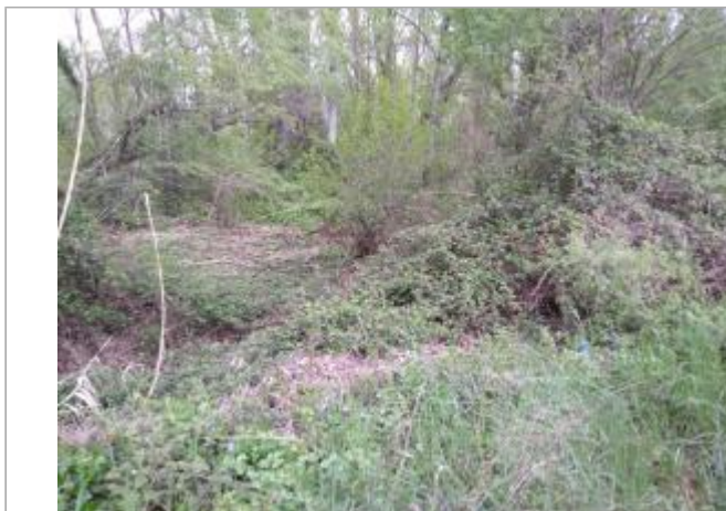
Haut de berge

Coordonnées WGS84 : X: 3.00818560 / Y: 43.44767060