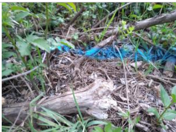
Dépôt en haut de berge