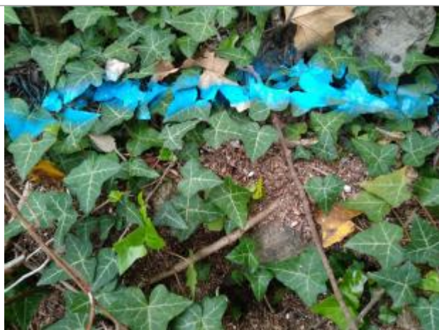
Dépôt en haut de berge