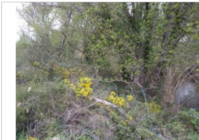
Haut de berge

Coordonnées WGS84 : X: 3.02678000 / Y: 43.45137420