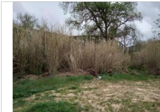
Cannes de provence

Coordonnées WGS84 : X: 3.02866970 / Y: 43.45441460