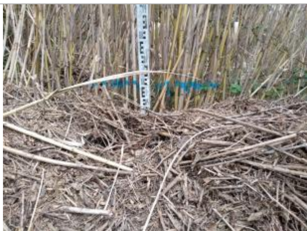
Dépôt contre les cannes de Provence