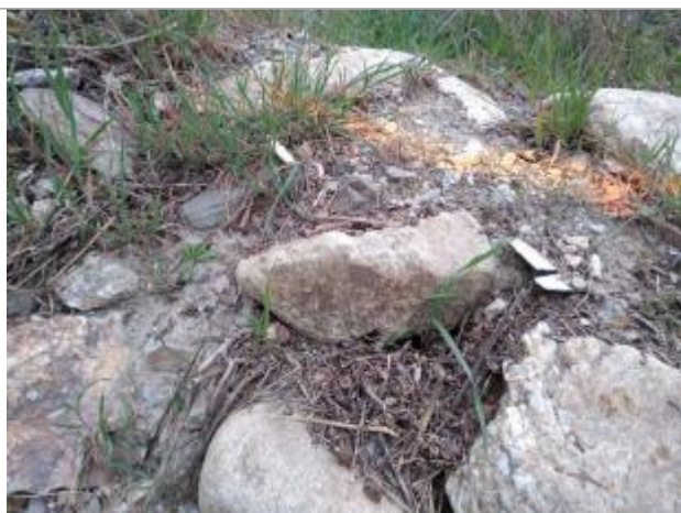
Dépôt en haut de berge

Altitude calculée de l'eau (en m) : 315.6 m