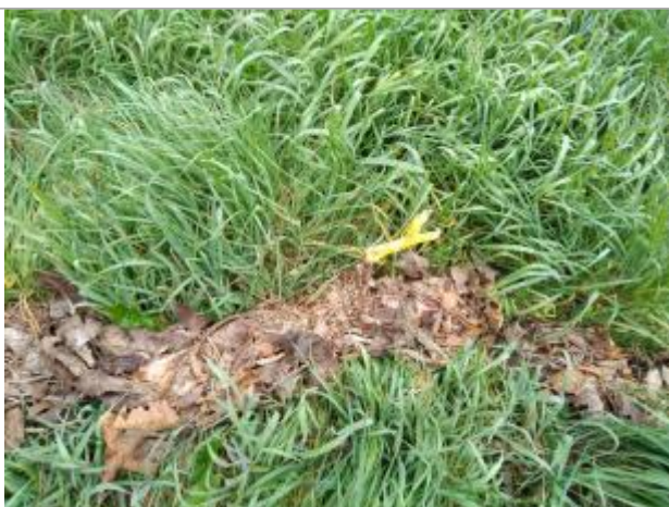
Dépôt dans l'herbe

Altitude calculée de l'eau (en m) : 317.69 m