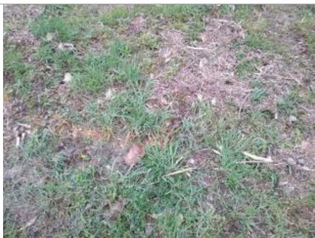
Dépôt en berge

Altitude calculée de l'eau (en m) : 315.36 m