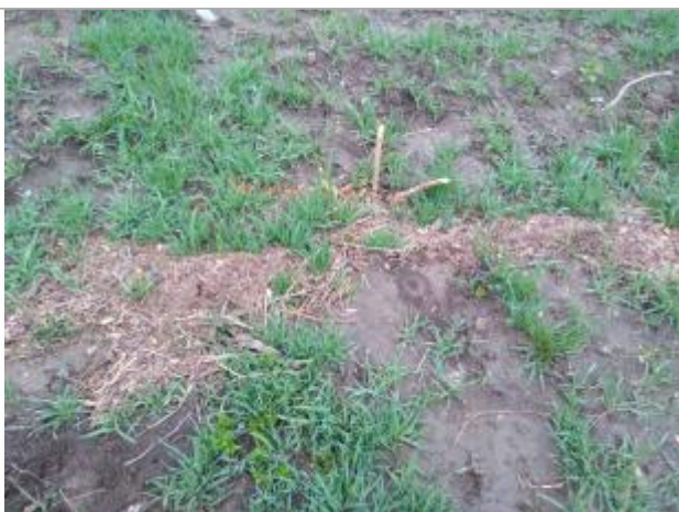
Dépôt au sol

Altitude calculée de l'eau (en m) : 314.06 m