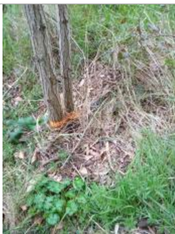
Dépôt en berge