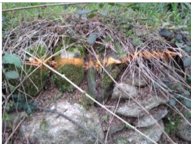
Trace sur le muret