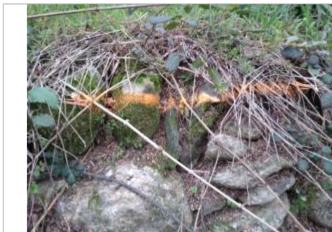
Trace sur le muret