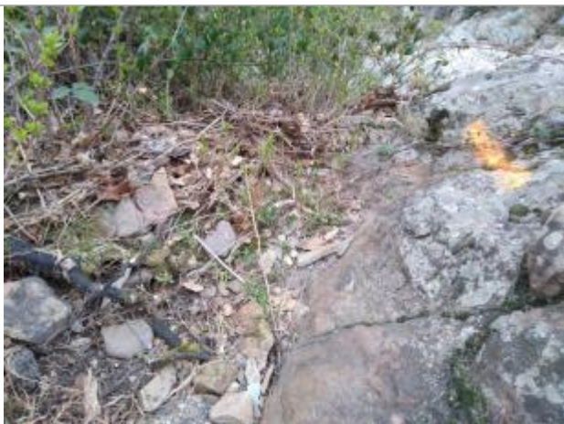
Dépôt dans la végétation reporté sur le rocher

Altitude calculée de l'eau (en m) : 223.19 m