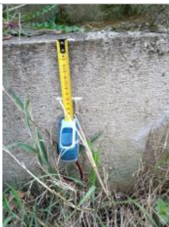
Trace sur l'ouvrage