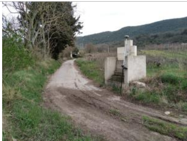
Poste de relevage

Coordonnées WGS84 : X: 3.10756000 / Y: 43.63450880