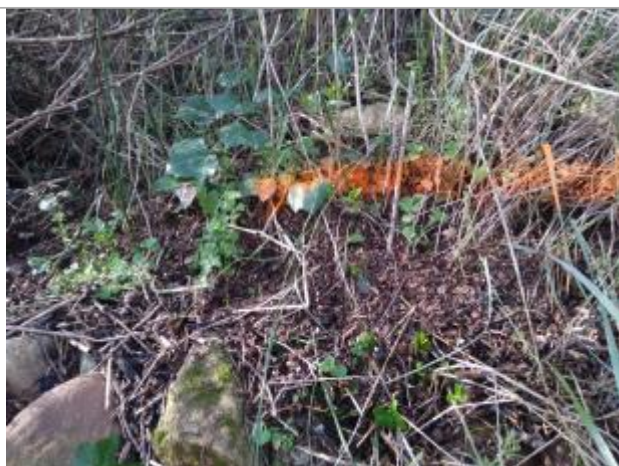
Dépôt en berge

Altitude calculée de l'eau (en m) : 210.48 m