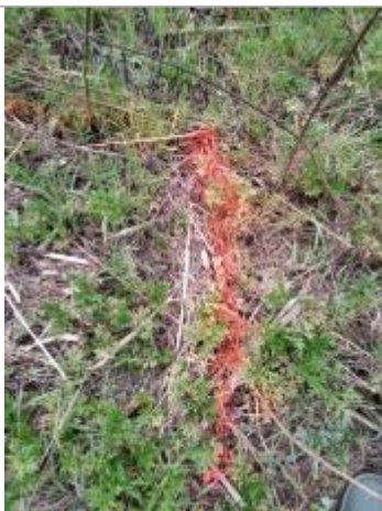
Dépôt au sol