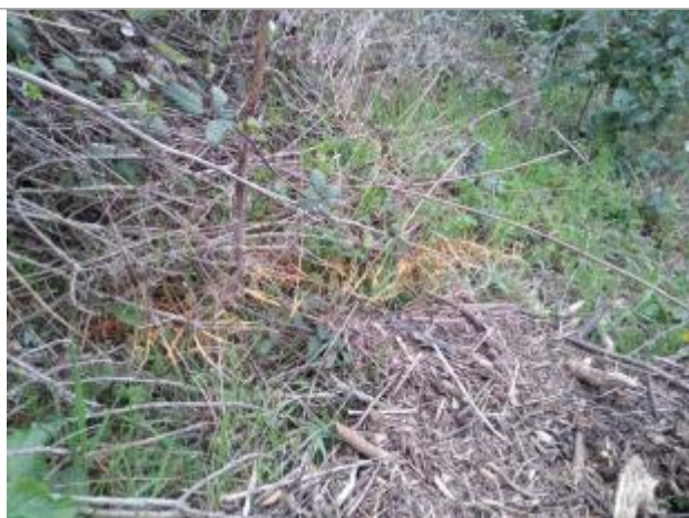
Dépôt en berge

Altitude calculée de l'eau (en m) : 194.22 m