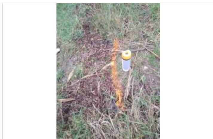
Dépôt en haut de berge